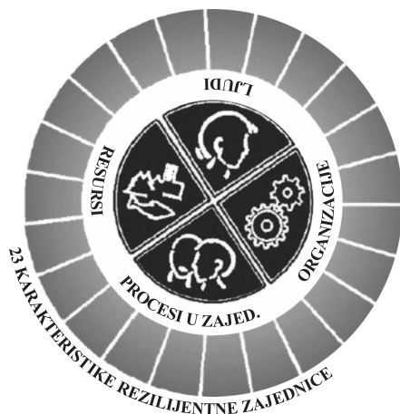
Slika 2 Model rezilijentne zajednice (USAID, 2006: 25)

Svaka dimenzija rezilijentnosti se razvija u niz detaljnijih ‘karakteristika rezilijentnosti’ koje predstavljaju specifične faktore koji se mogu ispitati u zajednici da bi se procenio nivo njene rezilijentnosti. Ovaj model definiše 23 karakteristike, ali one nisu konačne jer je svaka zajednica jedinstvena. Zajednice će doživeti različit nivo rezilijentnosti na svakoj karakteristici, a ovi nivoi se mogu promeniti tokom vremena (USAID, 2006: 26).